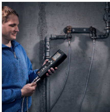
Contrôle automatisé sans dispositif d'injection