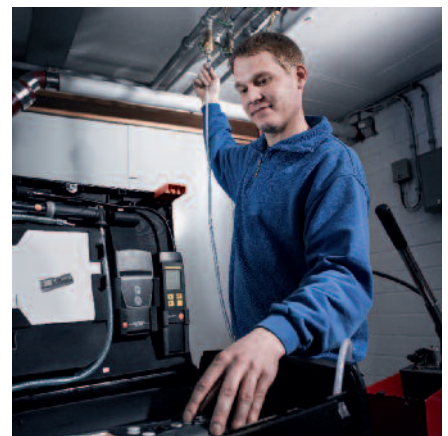
Contrôle des conduites d'eau sanitaire et usées