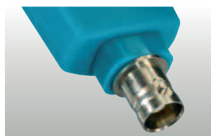
testo 206-pH3: Electrode pH 3 avec interface BNC