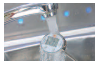
Nettoyage du mini-thermomètre par simple rinçage sous l'eau.